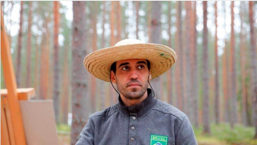
Artista retorna ao Brasil após trajetória em academias de arte da Rússia

CIDADES POLICIAL ESTADO POLÍTICA ESPORTES AGRICULTURA SAÚDE ECONOMIA BRASIL MAIS ≡ Q